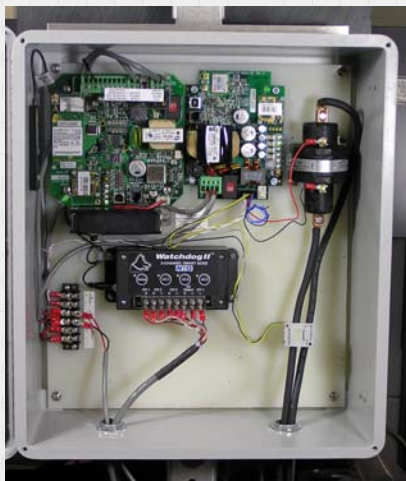
Armarios opcionales integradas con la estación base, Smart Nodo, interruptor y relé interruptor de mercurio (100A Hg)