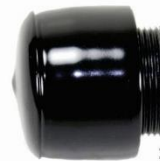
#118-064 Cap w/ Flat Tip